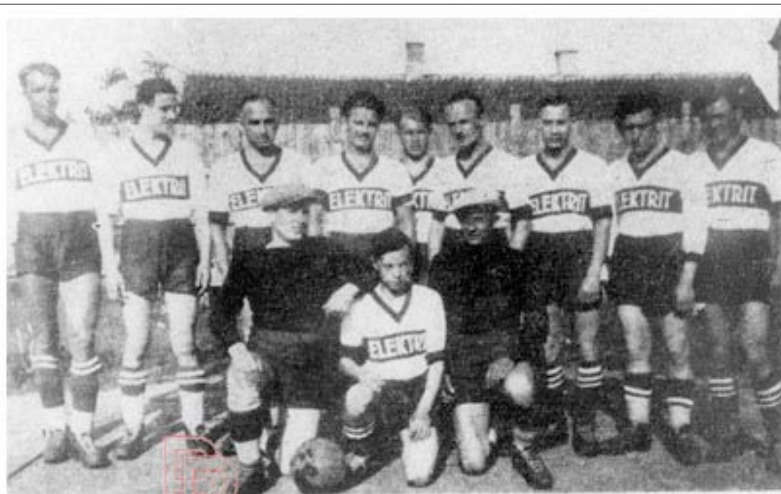
Drużyna piłkarska R. K. S. „Elektrit”.

Gamyklos mėnraštis „Elektrit-Radio. Wiadomości Techniczne“