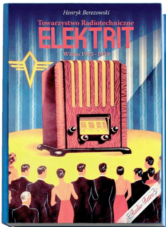
Knyga apie „Elektrit“