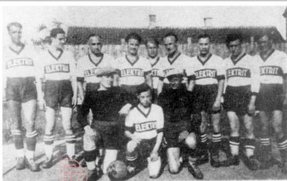
Drużyna piłkarska R. K. S. „Elektrit“.

Gamyklos mėnraštis „Elektrit-Radio. Wiadomości Techniczne“