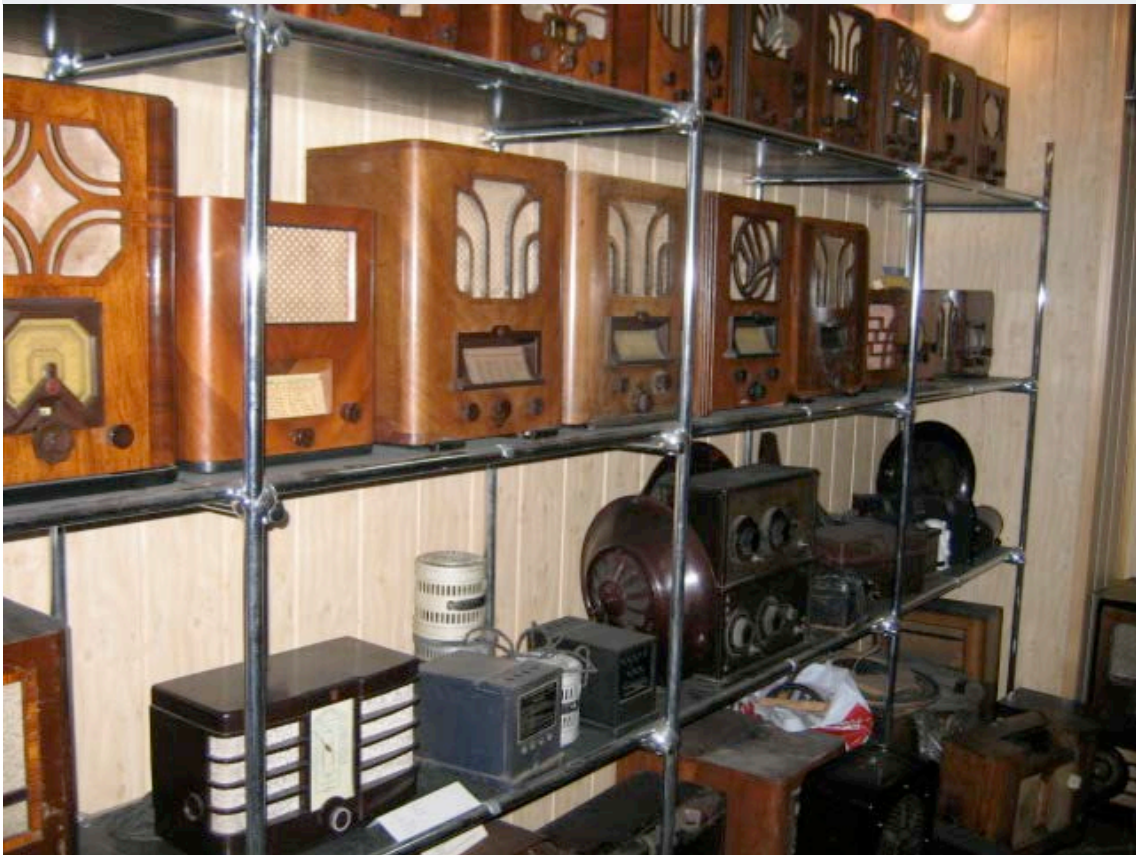
Stilinga „Elektrit“ produkcija